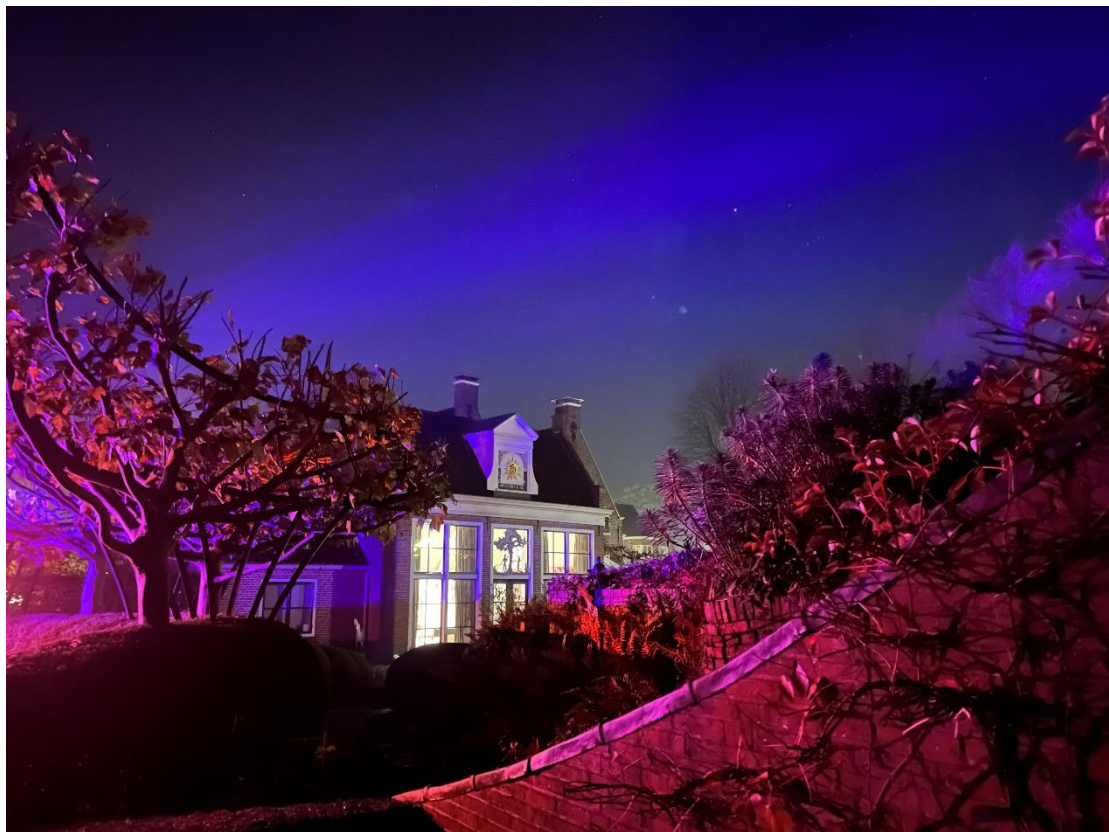
Oranjerie tijdens Schitteringen .

In bijlage 3 is een overzicht te vinden van de activiteiten en workshops die plaatsvonden in 2023.