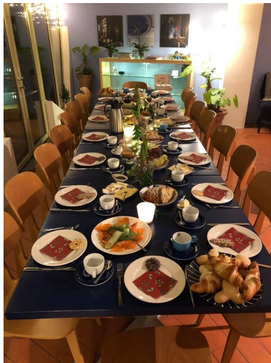
Kerstontbijt voor de Businessclub in december 2023.

De Businessclub is in 2023 regelmatig bij elkaar geweest. De bijeenkomsten hadden als thema 'kunst en musea', en werden goed bezocht. In bijlage 9 is een overzicht te vinden van de activiteiten voor de leden van de Businessclub in 2023.