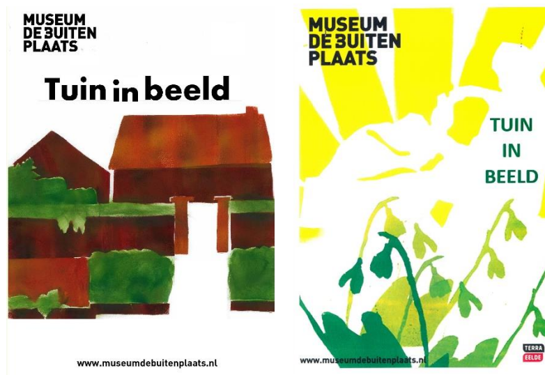
Winnende posters van de examenopdracht.

Ook is er voor de examenklassen een opdracht waarbij ze beeldmateriaal verzamelen in de beeldentuin en hiervoor een poster ontwerpen. Museum De Buitenplaats fungeert hier als opdrachtgever. Zij vragen een poster te ontwerpen om de tuin onder de aandacht te brengen waarbij rekening wordt gehouden met kleurgebruik, lettertype en het gebruik van logo's. Er wordt een slogan gegeven welke zij op de poster verwerken. Vanuit elke klas wordt een favoriet gekozen, welke als daadwerkelijke poster in het museum wordt opgehangen.