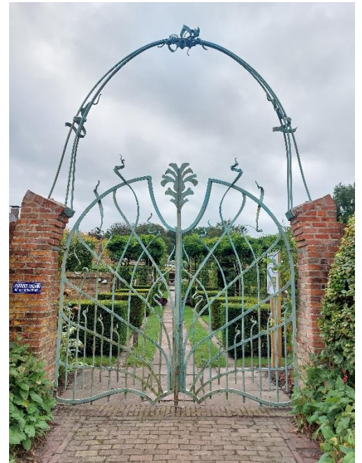
Tuinhek, Willem Jonker, 2000

In bijlage 4 is een overzicht te vinden van het specifieke onderhoud en de beplanting in de museumtuin in 2023.