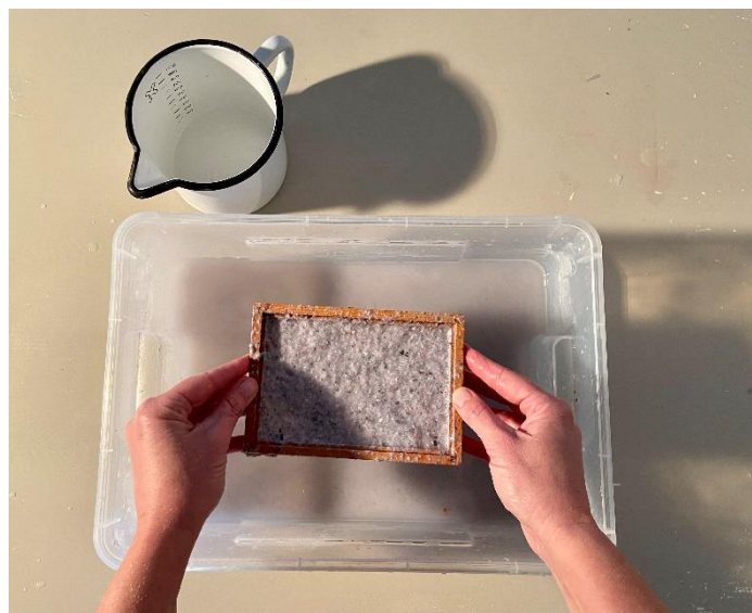
Workshop papier van papier.

Bij de opening van de tentoonstelling Match werden er workshops aangeboden in de Oranjerie. Er kon een collage gemaakt worden, en er kon gewerkt worden aan een stiftgedicht.