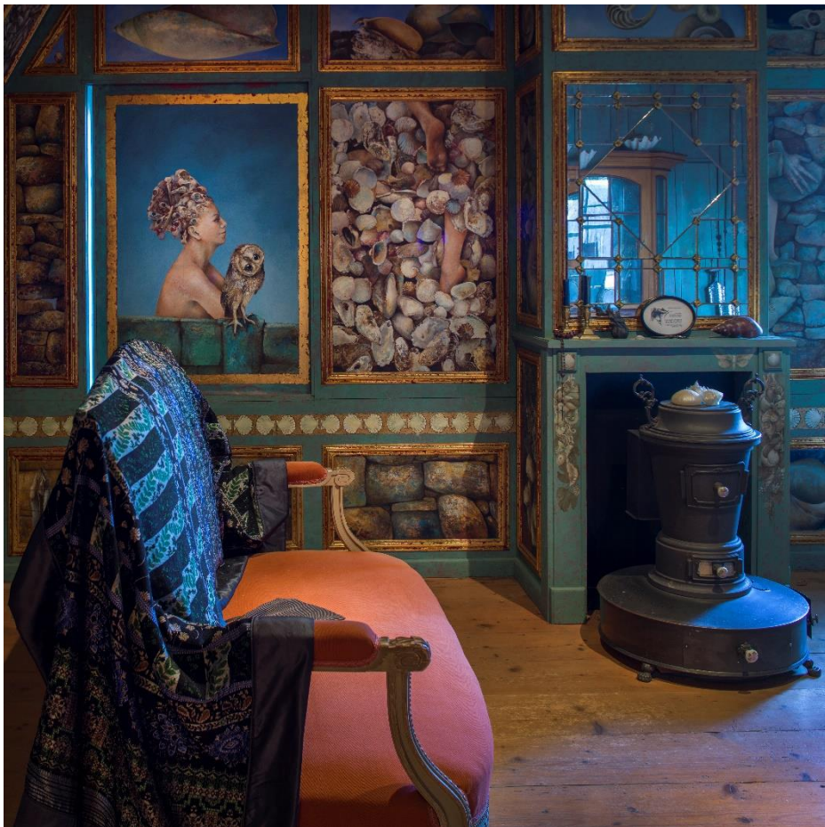
Naturaliënkabinet in het Nijsinghuis, nu elke doordeweekse dag te zien tijdens de rondleiding. Geschilderd door Clary Mastenbroek. Foto: Sake Elzinga, 2021.

Om meer bezoekers de gelegenheid te geven verdiepende informatie over het Nijsinghuis in te winnen, wordt sinds half 2023 een rondleiding op dinsdag, woensdag, donderdag en vrijdag aangeboden. Deze rondleiding duurt circa 60 minuten en geeft bezoekers de gelegenheid om ook de bovenverdieping van het Nijsinghuis te bezichtigen, waar kunstenaars Clary Mastenbroek en Olga Wiese elk een vertrek beschilderen. Voorheen vond de rondleiding tweemaal op de dinsdag en vrijdag plaats.