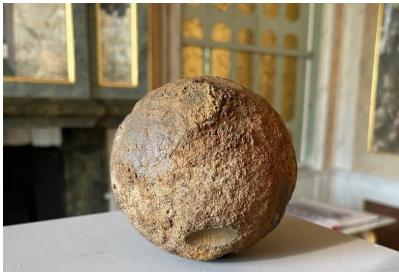
Kanonskogel (twaalfponder), gietijzer, c. 1590 – 1680.

Op 21 januari 2023 is de lindeboom nabij de achtergevel van het Nijsinghuis gekapt uit veiligheidsoverwegingen. Tijdens deze werkzaamheden stuitte werknemers van Dolmans Landscaping Group op een voorwerp, die voorheen begraven was onder de wortels van de boom. Het bleek om een gietijzeren kanonskogel te gaan, een zogeheten twaalfponder. Vooralnog is de datering en herkomst van de kogel onzeker. Naar schatting dateert deze uit eind-zestiende of zeventiende eeuw.