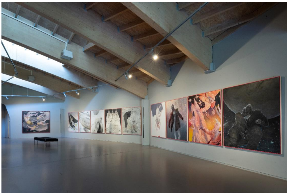
Zaalfoto Vrouwen van De Buitenplaats .

In het najaar van 2023 vond er weer een collectiepresentatie plaats, onder de noemer Tijdsbeeld – Tien jaar aanwinsten . Schenkingen, aankopen en legaten die Museum De Buitenplaats de afgelopen tien jaar heeft vervaardigd stonden hier in het middelpunt.